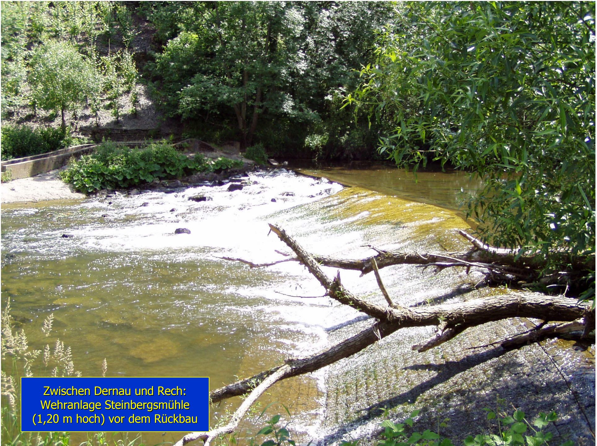
Zwischen Dernau und Rech: Wehranlage Steinbergsmühle (1,20 m hoch) vor dem Rückbau