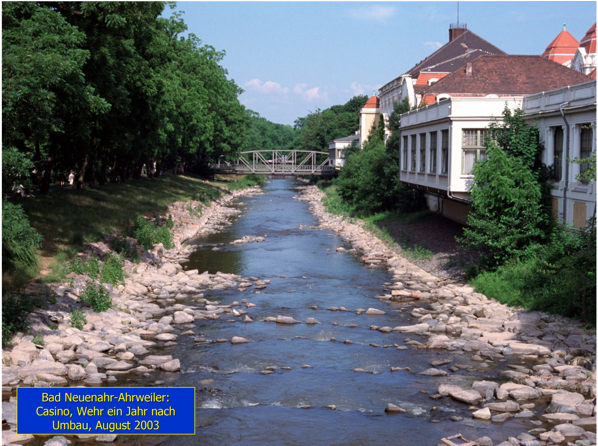
Bad Neuenahr-Ahrweiler: Casino, Wehr ein Jahr nach Umbau, August 2003