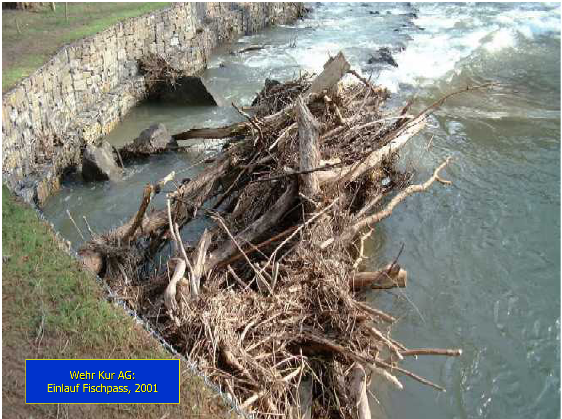
Wehr Kur AG: Einlauf Fischpass, 2001