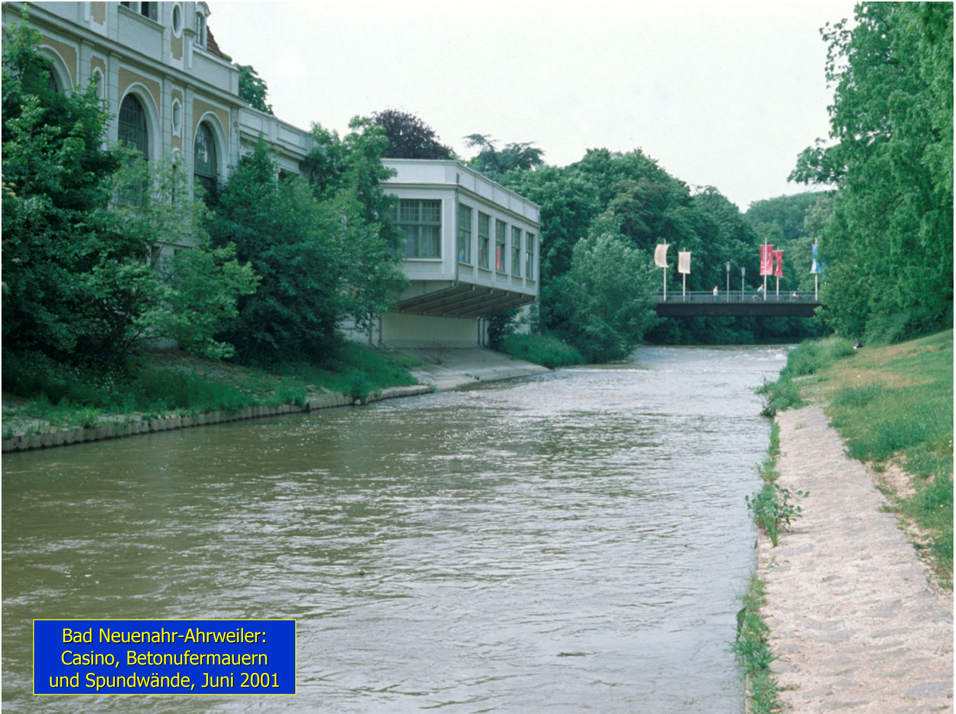
Bad Neuenahr-Ahrweiler: Casino, Betonufermauern und Spundwände, Juni 2001