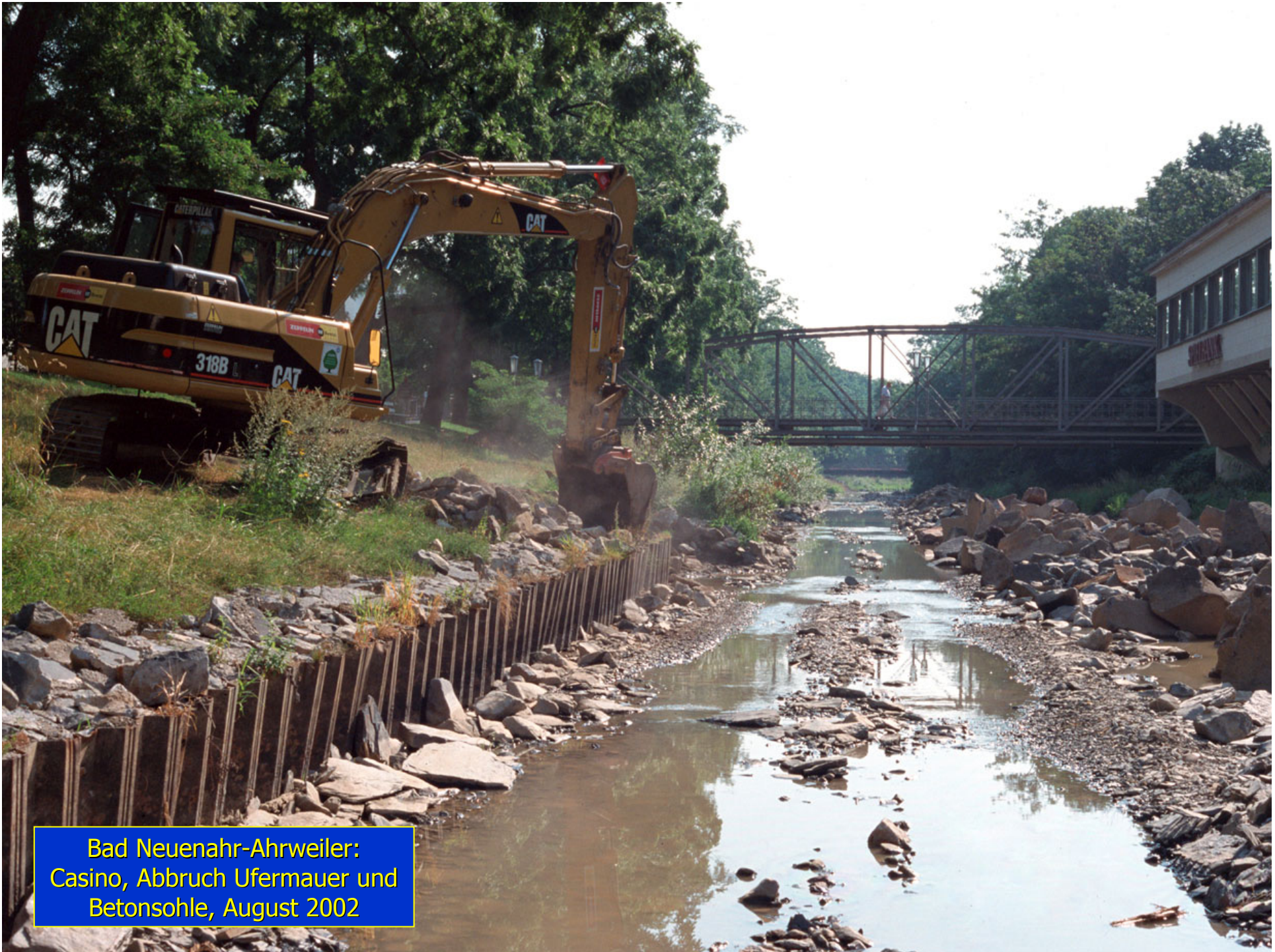
Bad Neuenahr-Ahrweiler: Casino, Abbruch Ufermauer und Betonsohle, August 2002