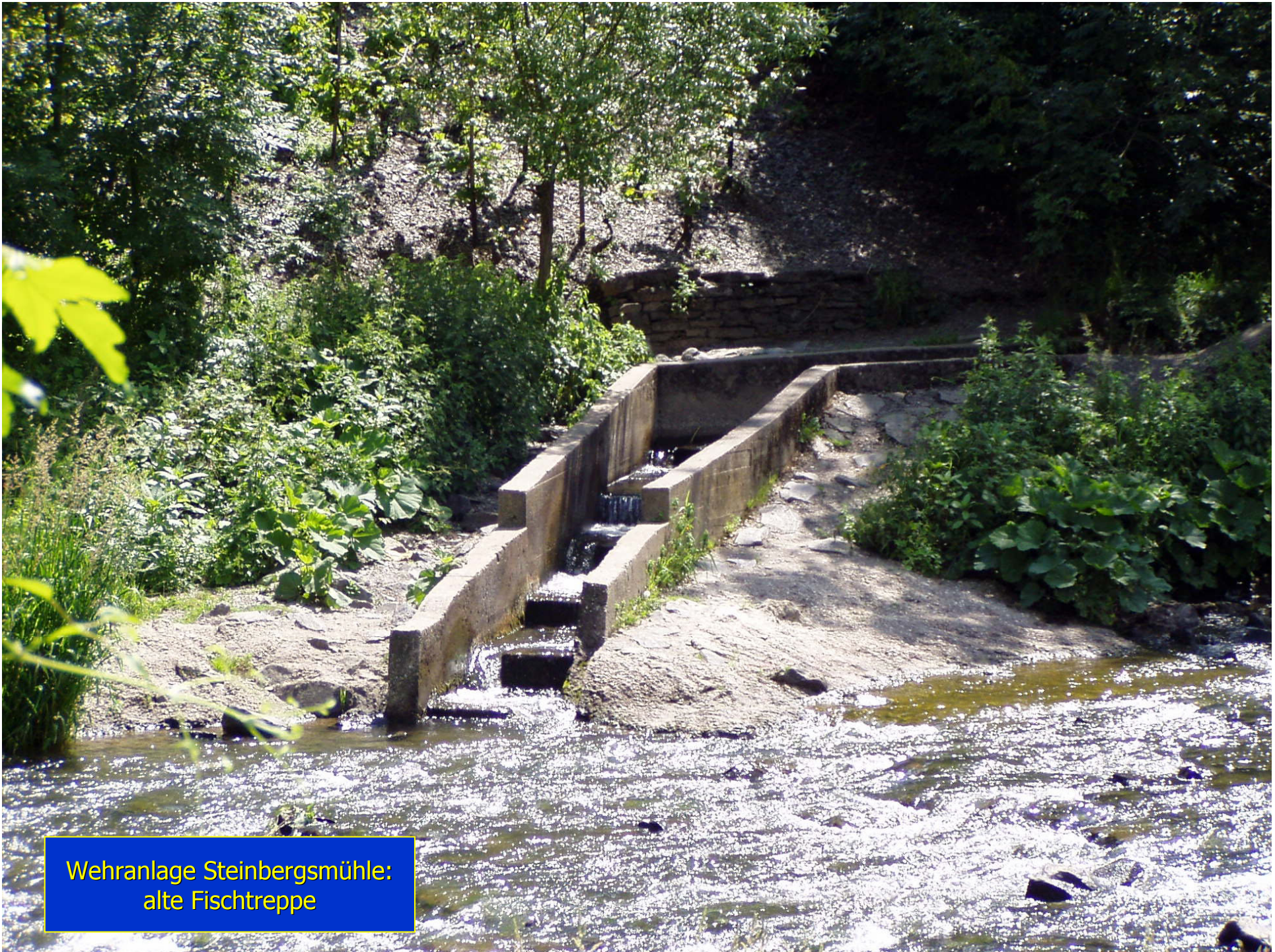
Wehranlage Steinbergsmühle: alte Fischtreppe