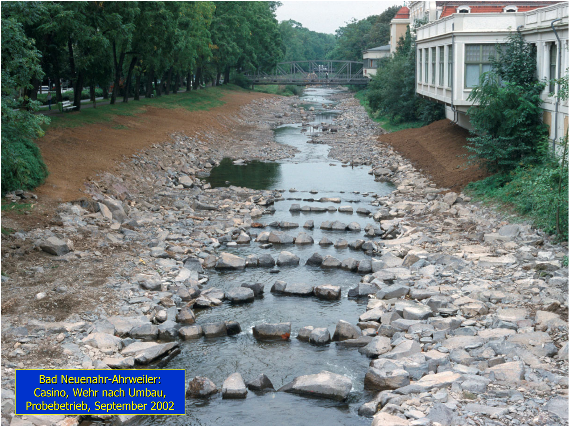
Bad Neuenahr-Ahrweiler: Casino, Wehr nach Umbau, Probetrieb, September 2002