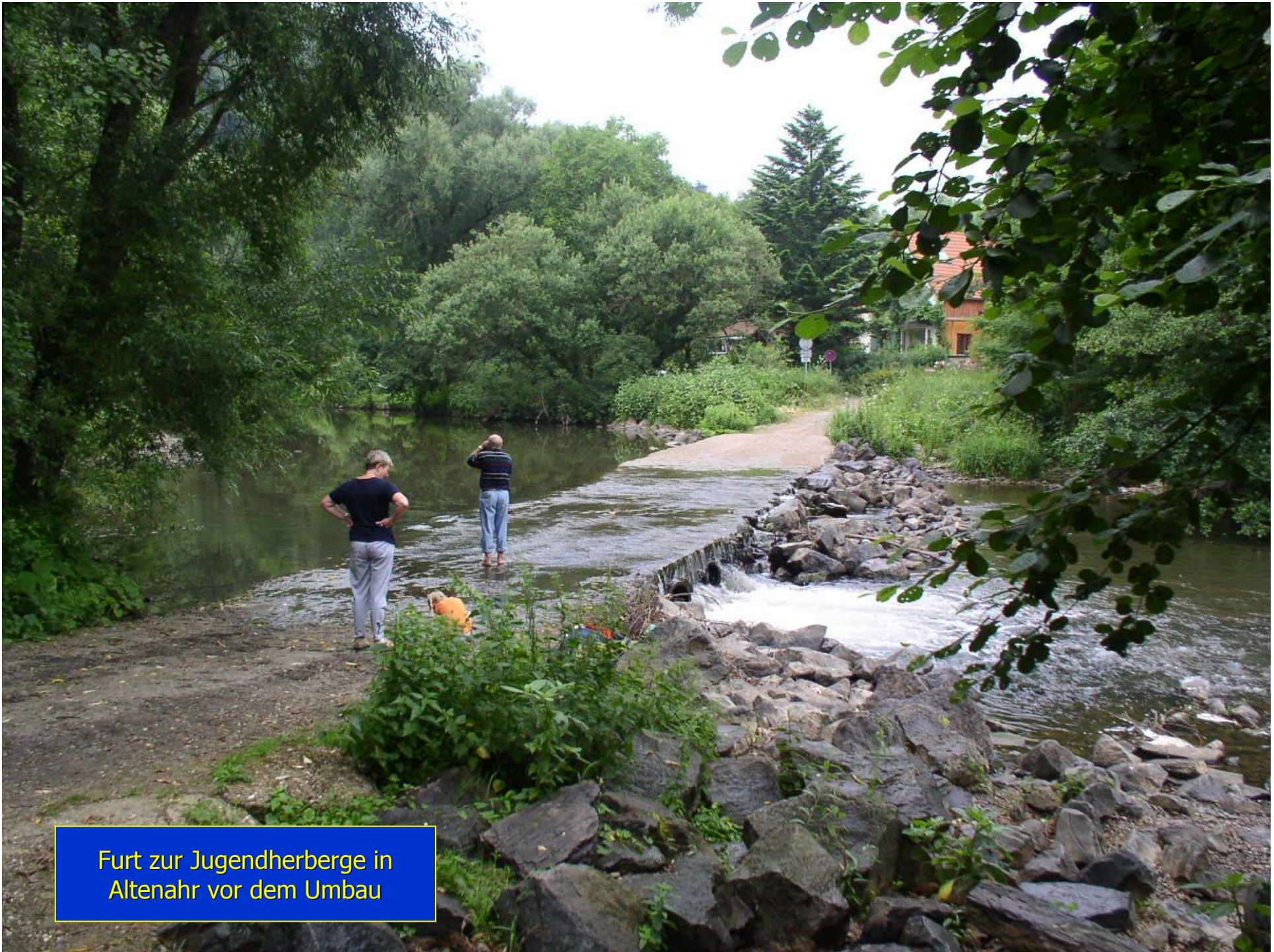
Furt zur Jugendherberge in Altenahr vor dem Umbau