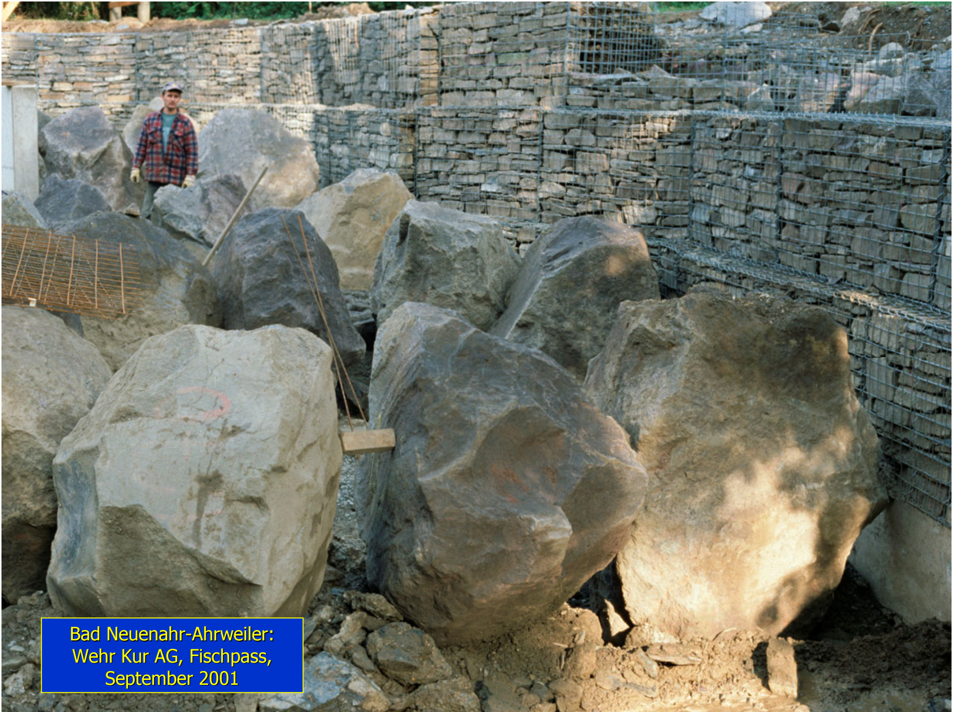
Bad Neuenahr-Ahrweiler: Wehr Kur AG, Fischpass, September 2001