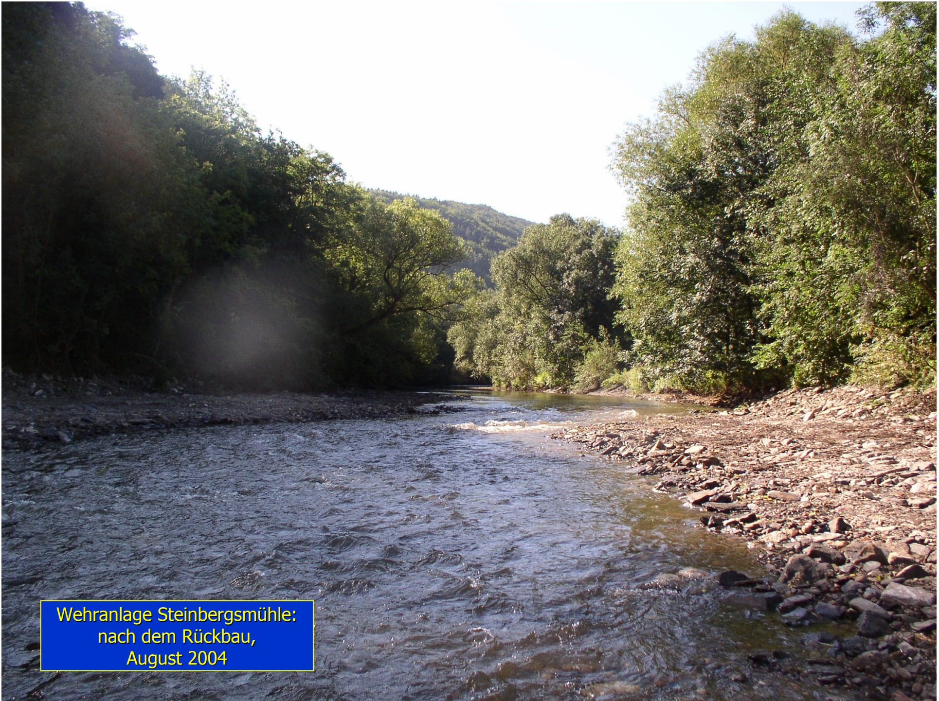
Wehranlage Steinbergsmühle: nach dem Rückbau, August 2004