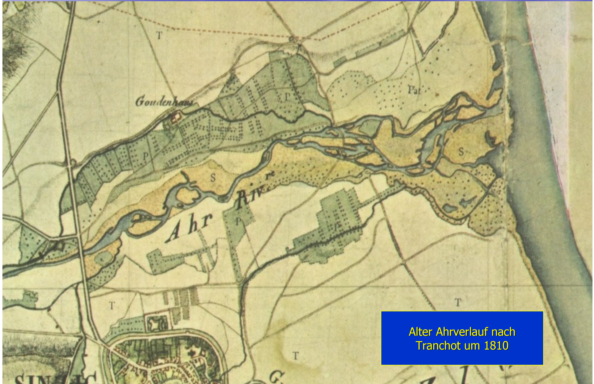
Alter Ahrverlauf nach Tranchot um 1810