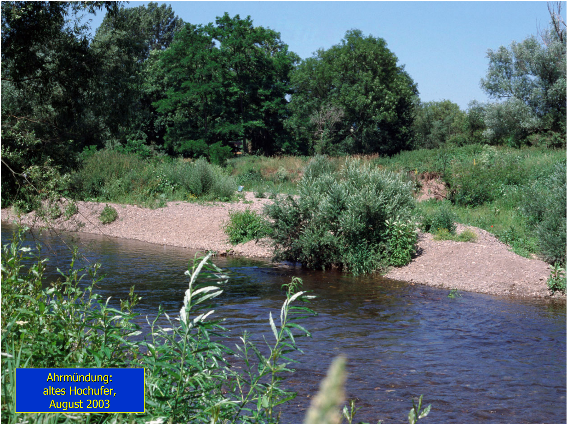
Ahrmündung: altes Hochufer, August 2003