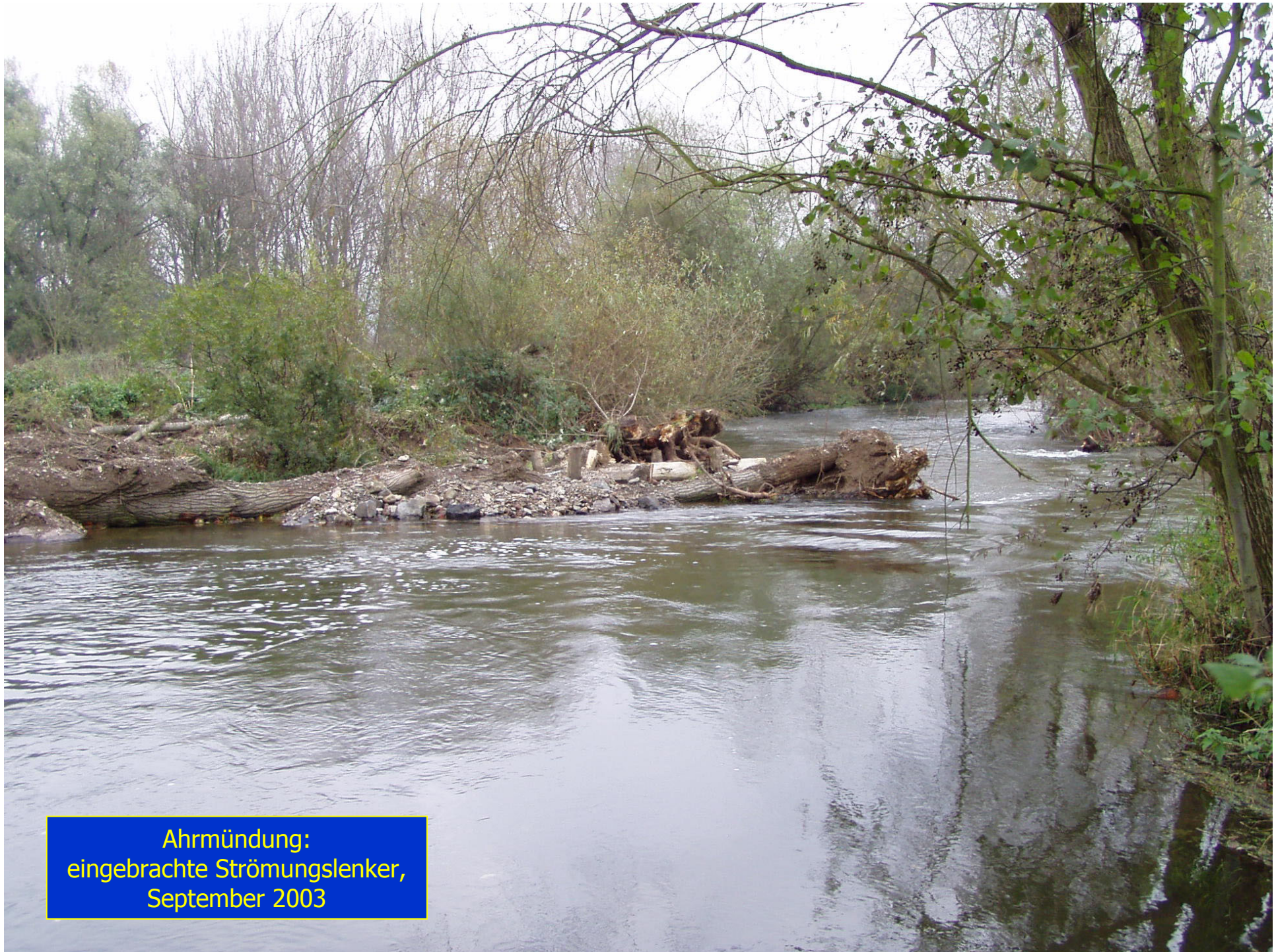
Ahrmündung: eingebrachte Strömungsenker, September 2003