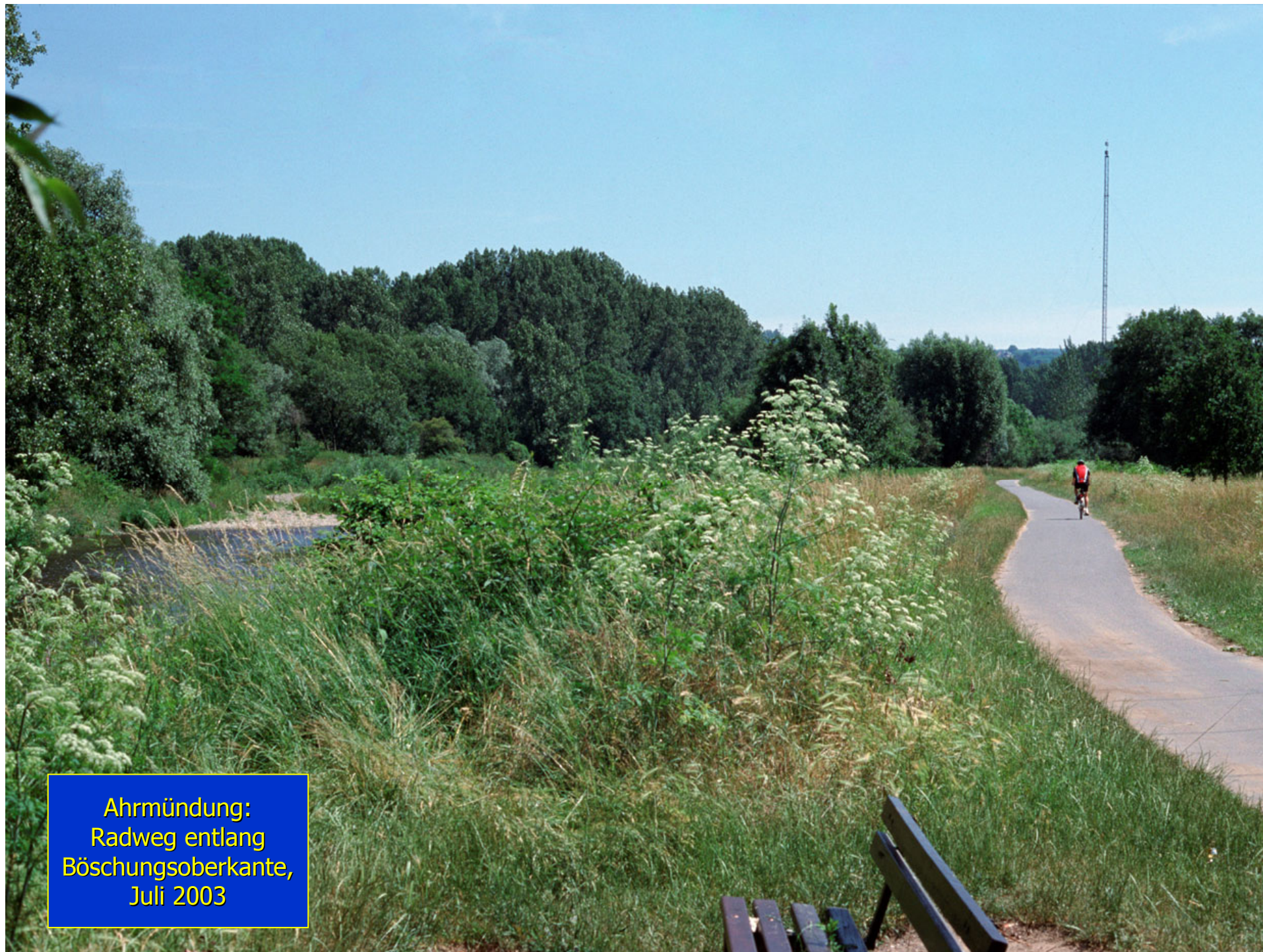
Ahrmündung: Radweg entlang Böschungsoberkante, Juli 2003