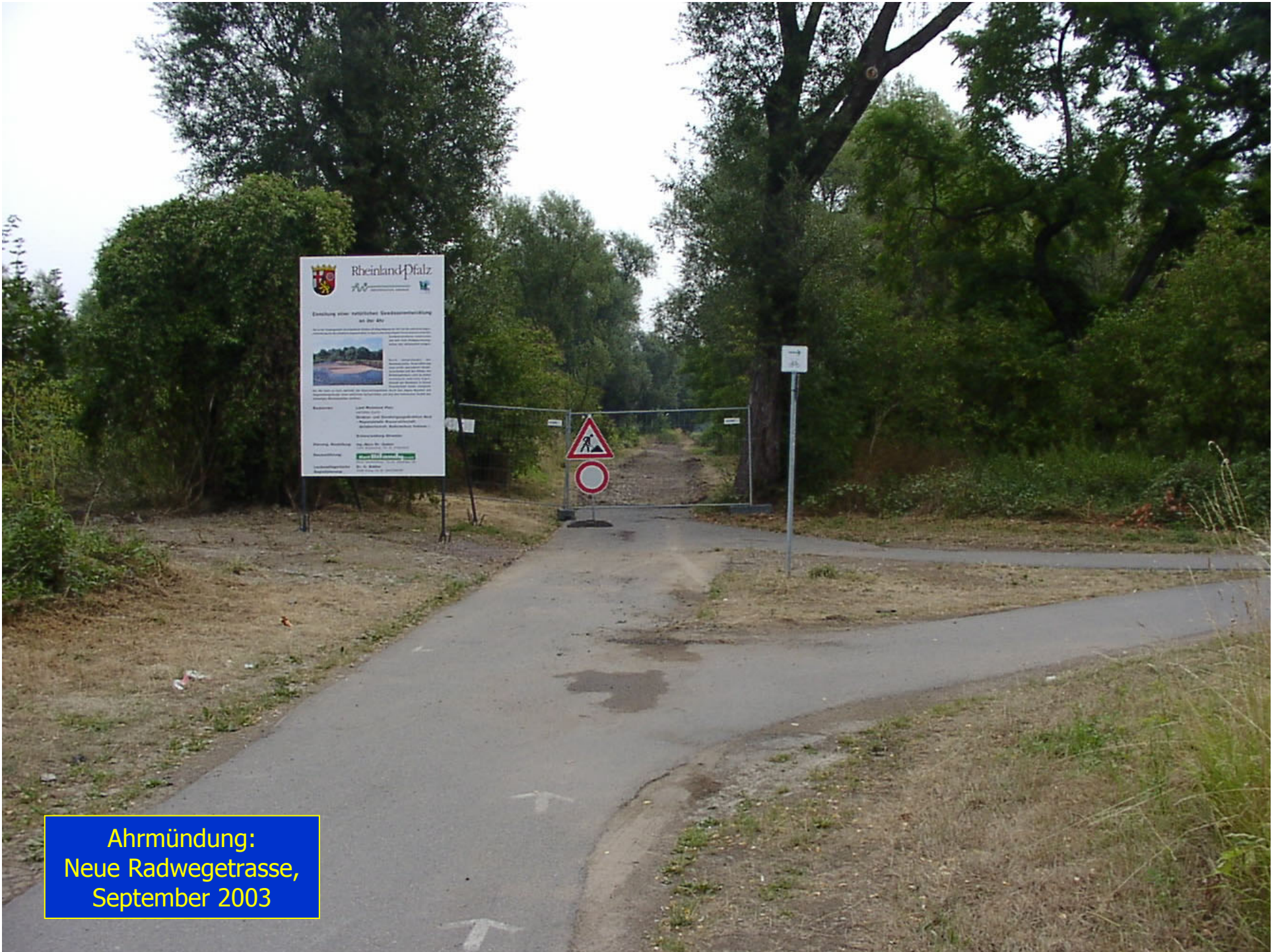
Ahrmündung: Neue Radwegetrasse, September 2003