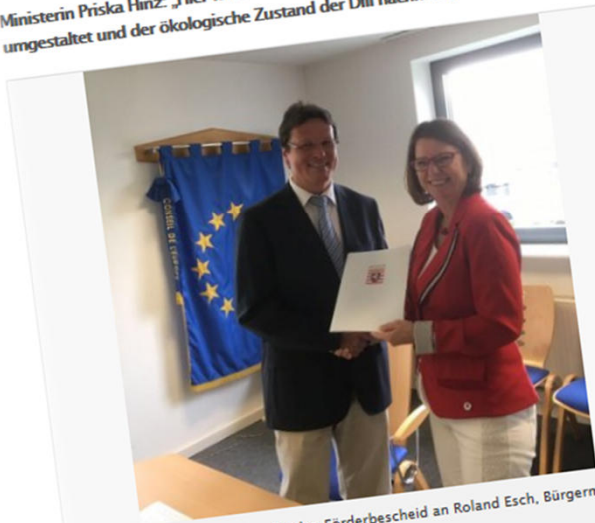
Ministerin Priska Hinz übergibt den Förderbescheid an Roland Esch, Bürgermeister von ABlar

Ministerin Priska Hinz: „Hier wird ein verbautes Fließgewässer naturnah umgestaltet und der ökologische Zustand der Dill nachhaltig verbessert.“